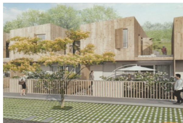
Casino ou Plantoun ?

La modification N° 6 du PLU de Boucau entraîne, sur la zone du projet de l'Îlot Biremont la suppression de toutes les places visiteurs et l'attribution d'une seule place de parking quel que soit le type d'appartement (140 à 150 logements). On peut penser que l'arrivée du BHNS décrit ci-dessus va booster les fréquences des bus passant par le bas Boucau. Pour autant, cela n'empêchera pas un apport très important de véhicules qui vont stationner d'une manière empirique, notamment sur les places Sé-mard et Péri. D'autres projets présentant les mêmes contraintes de stationnement vont voir le jour dans le même périmètre. Où va-t-on mettre toutes ces voitures ?